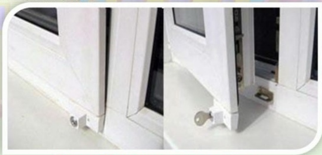
Замок блокировщик с ключом

Можно воспользоваться специальными замками блокираторами, которые предлагают установщики пластиковых окон.