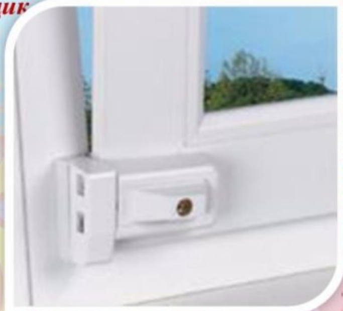
Блокировщик с кнопкой